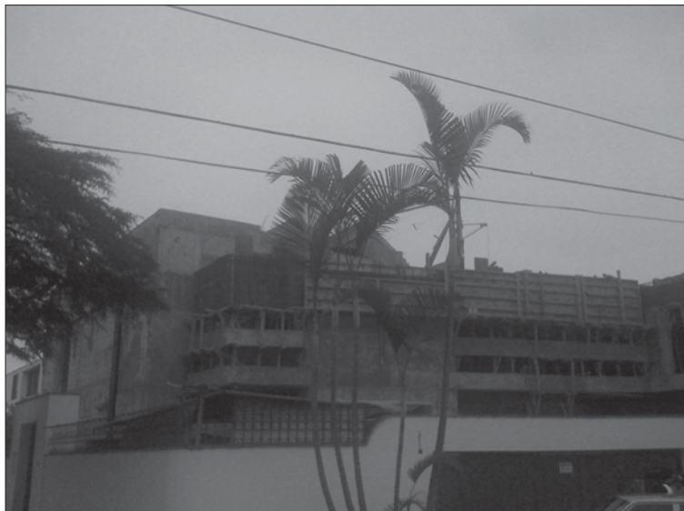
Vista exterior del importante avance