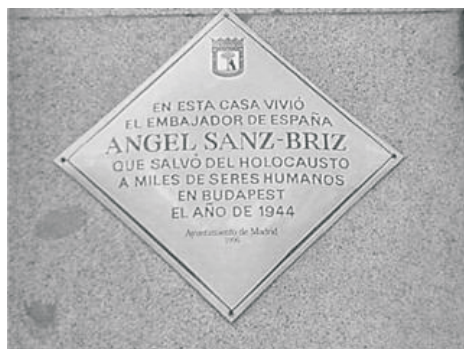
Placa que colocó el Ayuntamiento de Madrid en el portal de la casa de Angel Sanz Briz en la calle Velázquez

(*) Página alojada en la Red Académica y de Investigación Nacional (RedIris). Creada y mantenida en Madrid, se dedica a difundir historia y cultura de los judíos de origen español. Incluye el acceso al foro de discusión "La Aljama de Sefarad". ( http://sefarad.rediris.es/ )