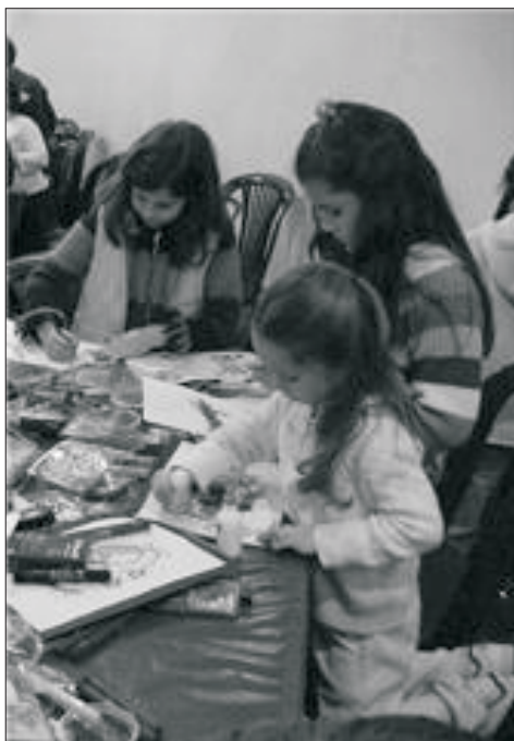
Más de 70 niños se divirtieron muchísimo preparando diversos trabajos manuales para la decoración de la Suca del Kahal el día Martes 25 de Septiembre.