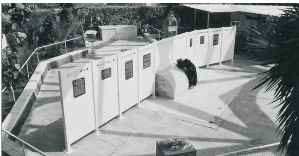
Tumba de Maimónides en Tiberiades, Israel

me quedan fuerzas" (Daniel 10:16). No ocurría así con Moisés, sino que le sobrevenia la palabra de Dios sin causarle temblor o debilitamiento de ningún tipo, tal como dice: "y habló el Eterno con Moisés frente a frente, tal como habla un hombre con su prójimo" (Éxodo 23:11) es decir, así como el hombre no se llena de pavor al hablar con su compañero, de la misma manera ocurría con Moisés, él no se estremecía cuando le sobrevenia la palabra de Dios, a pesar de estar Moisés en el grado supremo de cercanía a Dios, como