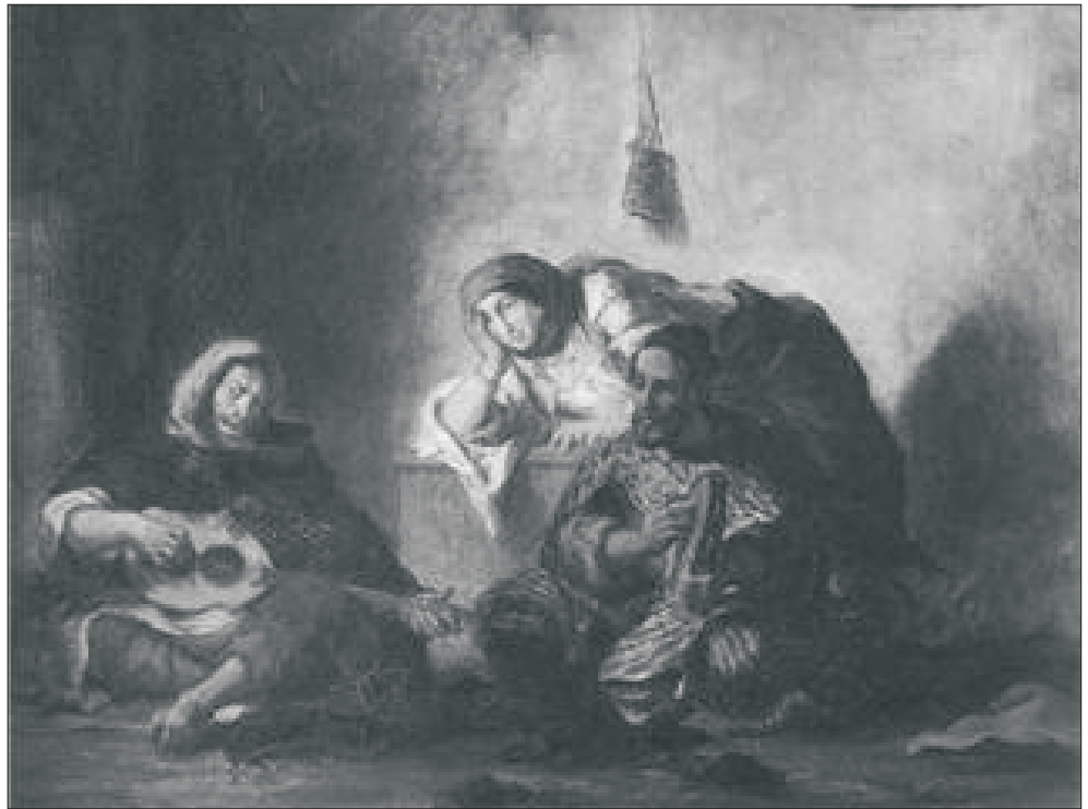
"Musicos sefaradíes" (1837), oleo de Eugène Delacroix (Museo Nacional del Louvre)