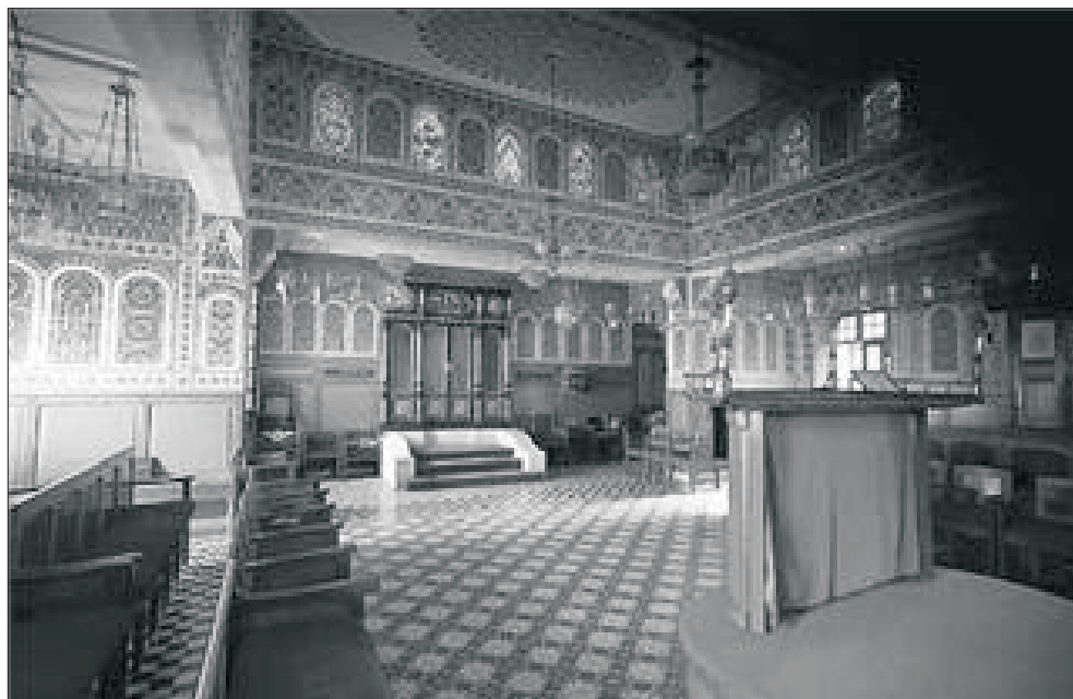
Sinagoga Saadon en Fez

(*) Página alojada en la Red Académica y de Investigación Nacional (RedIris) . Creada y mantenida en Madrid, se dedica a difundir historia y cultura de los judíos de origen español. Incluye el acceso al foro de discusión "La Aljama de Sefarad". ( http://sefarad.rediris.es/ )