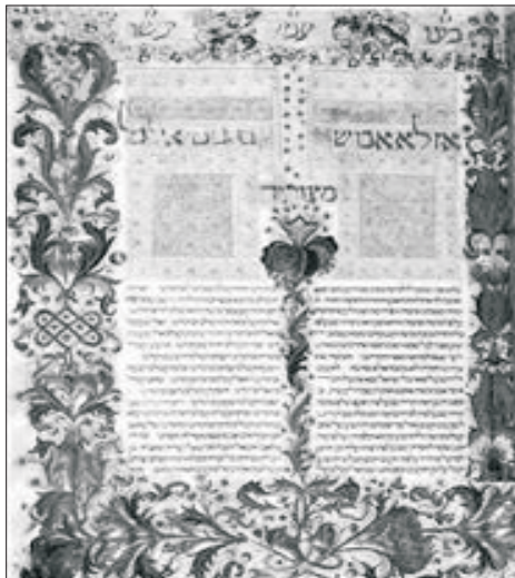
Manuscrito ilustrado del Mishne Tora hecho en Lisboa en 1472